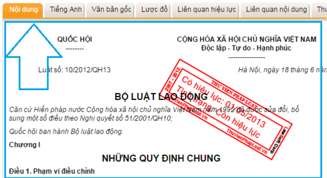
Hình: Xem nội dung văn bản Online

Tiện ích xem văn bản cho phép tất cả người dùng xem văn bản đã được xử lý hình thức với định dạng chuẩn.