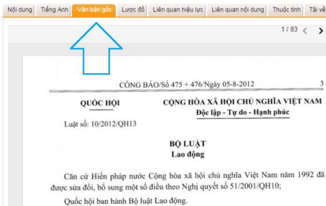
Hình: Xem văn bản gốc online

Tiện ích xem văn bản Gốc cho phép thành viên Basic và Pro xem bản Scan từ Công báo của văn bản, qua đó đảm bảo sự tin tưởng tuyệt đối từ nội dung đến hình thức của văn bản.