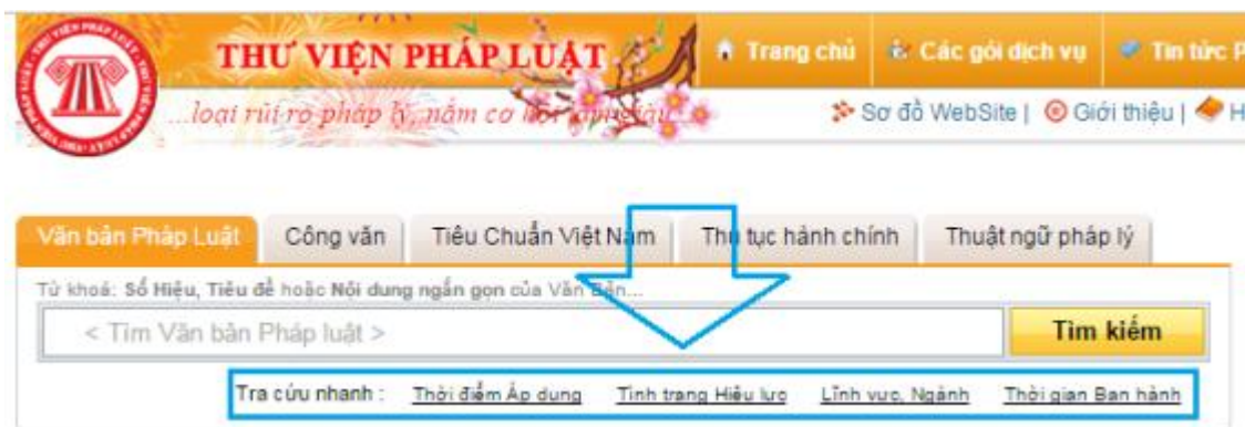
Hình: Các công cụ tìm kiếm nhanh

ThuVienPhapLuat.vn cung cấp những chức năng tìm kiếm nhanh sau: