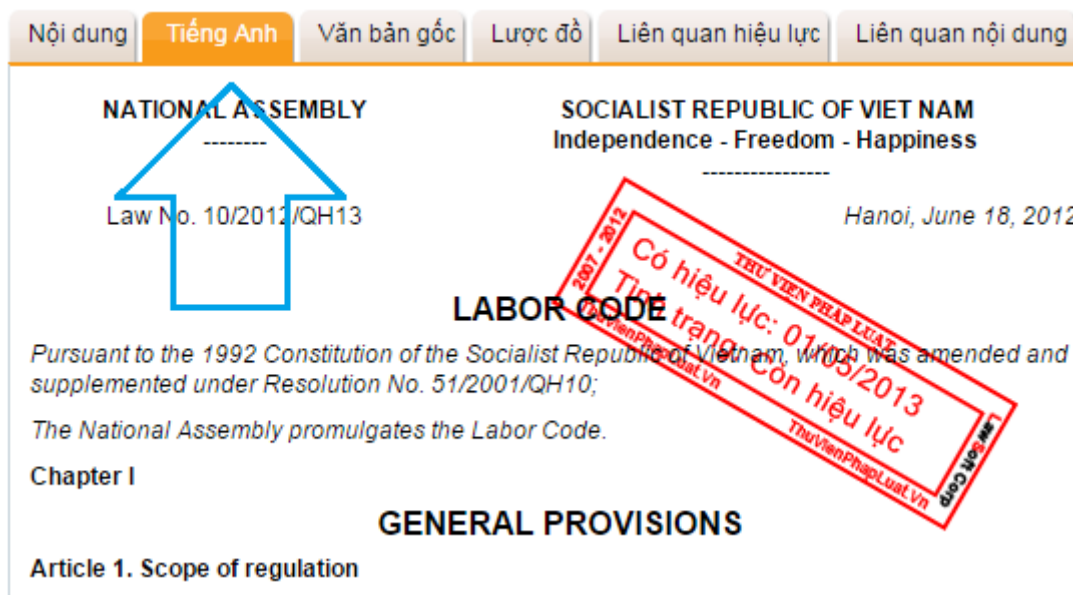
Hình: Xem văn bản Tiếng Anh online

Một số văn bản quan trọng sẽ được ThuVienPhapLuat.vn dịch sang tiếng Anh và cung cấp cho người dùng Pro sử dụng song song với văn bản Tiếng Việt.